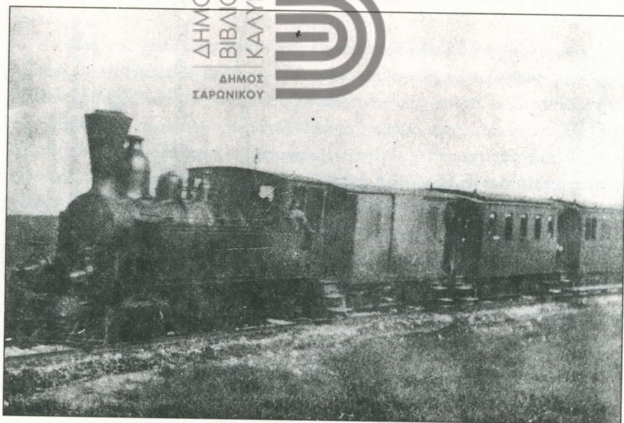
2. Το τρένο του Λαυρίου στον κάμπο των Μεσογείων, το 1890