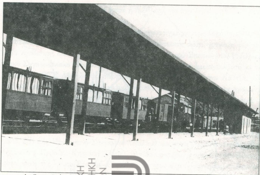
1. Ο σταθμός Αττικής, αφετηρία της γραμμής Λαυρίου μέχρι το 1929