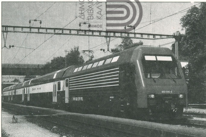
4. Σύγχρονο ηλεκτρικό προαστιακό τρένο περιοχής Ζυρίχης. Κάτι ανάλογο προτείνεται να κινηθεί στη νέα γραμμή Αθήνας-Λαυρίου