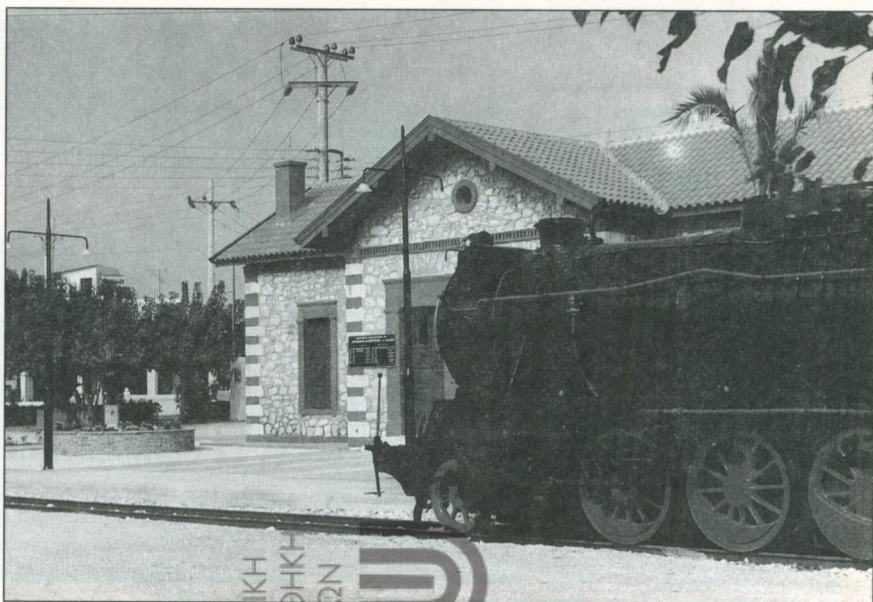
5. Φωτογραφία από τον αναπαλαιωθέντα σταθμό Μαρκόπουλου

ΔΗΜΟΤΙΚΗ ΒΙΒΛΙΟΘΗΚΗ ΚΑΛΥΔΙΩΝ ΔΗΜΟΣ ΣΑΡΩΝΙΚΟΥ