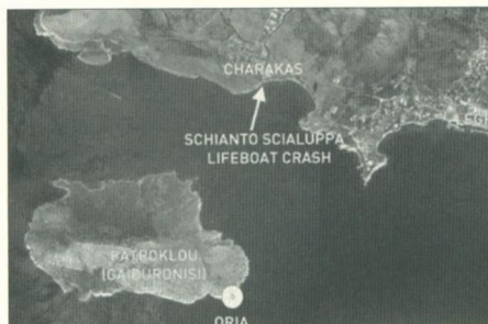
Το σημείο του ναυαγίου στη νήσο Πάτροκλο.