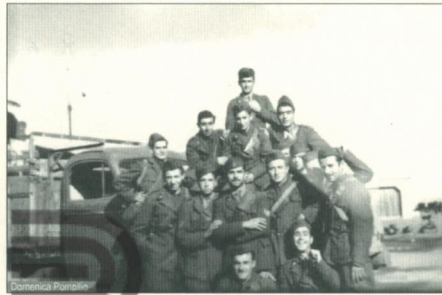
Ιταλοί στρατιώτες στην Ρόδο (1942-43) κατά τη διάρκεια της ιταλικής Κατοχής στα Δωδεκάνησα.