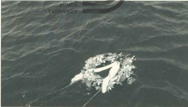
Τιμή στους νεκρούς του ORIA.