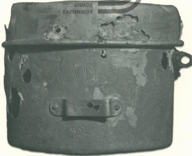
Η καρβάνια του Ντίνο Μενικάτσι από το το Βαϊάνο Ιταλίας, που χάθηκε στο Ναυάγιο του ΟΡΙΑ. Βρέθηκε από τον δύτη Αριστοτέλη Ζερβούδη.