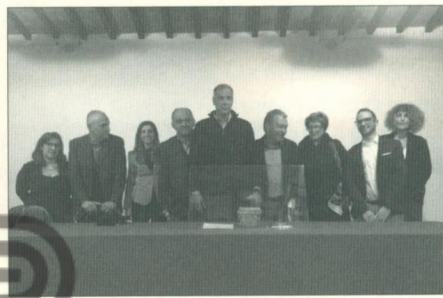
Από την Τελετή Παράδοσης της Καραβάνας στο Βαϊάνο.