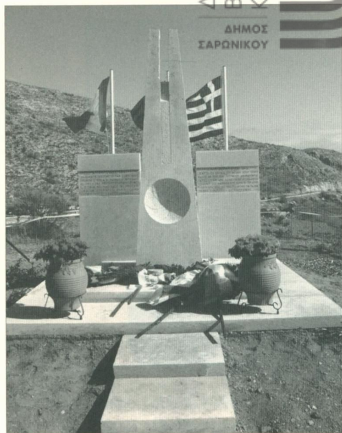
Το μνημείο αφιερωμένο στα θύματα του Ναυαγίου του ORIA, φιλοτεχνημένο από τον γλύπτη Θύμιο Πανουργιά το 2014 που έγινε από τον Δήμο Σαρωνικού στο 58ο χλμ. της Παραλιακής Λεωφόρου Αθηνών-Σουνίου (όρια Δήμου Σαρωνικού και Δήμου Λαυρεωτικής).